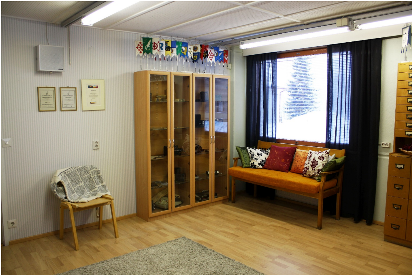
ns. peräkamari soveltuu monenlaiseen käyttöön