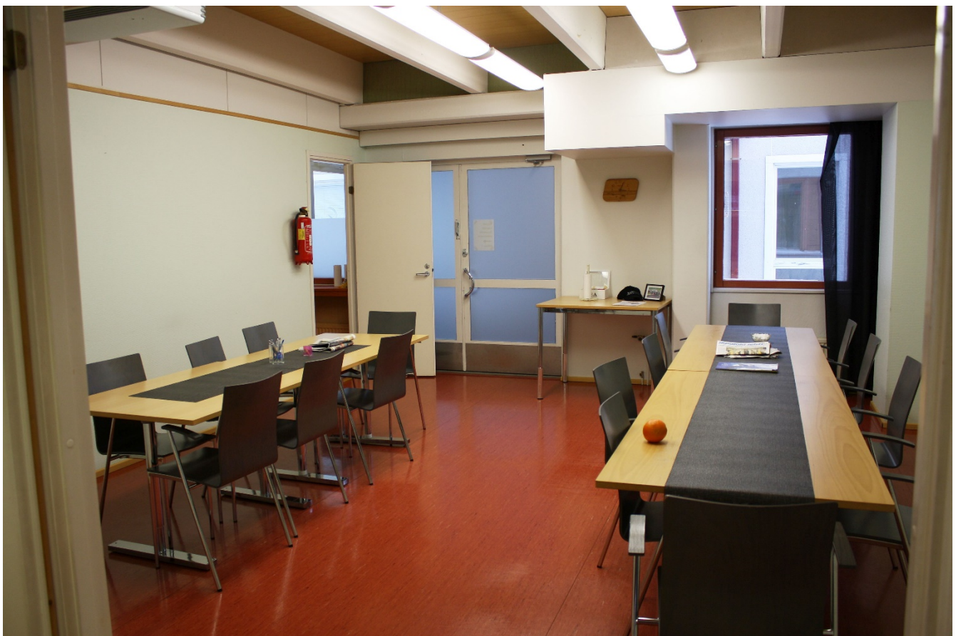
Sanomien taukotila ja kahviotila