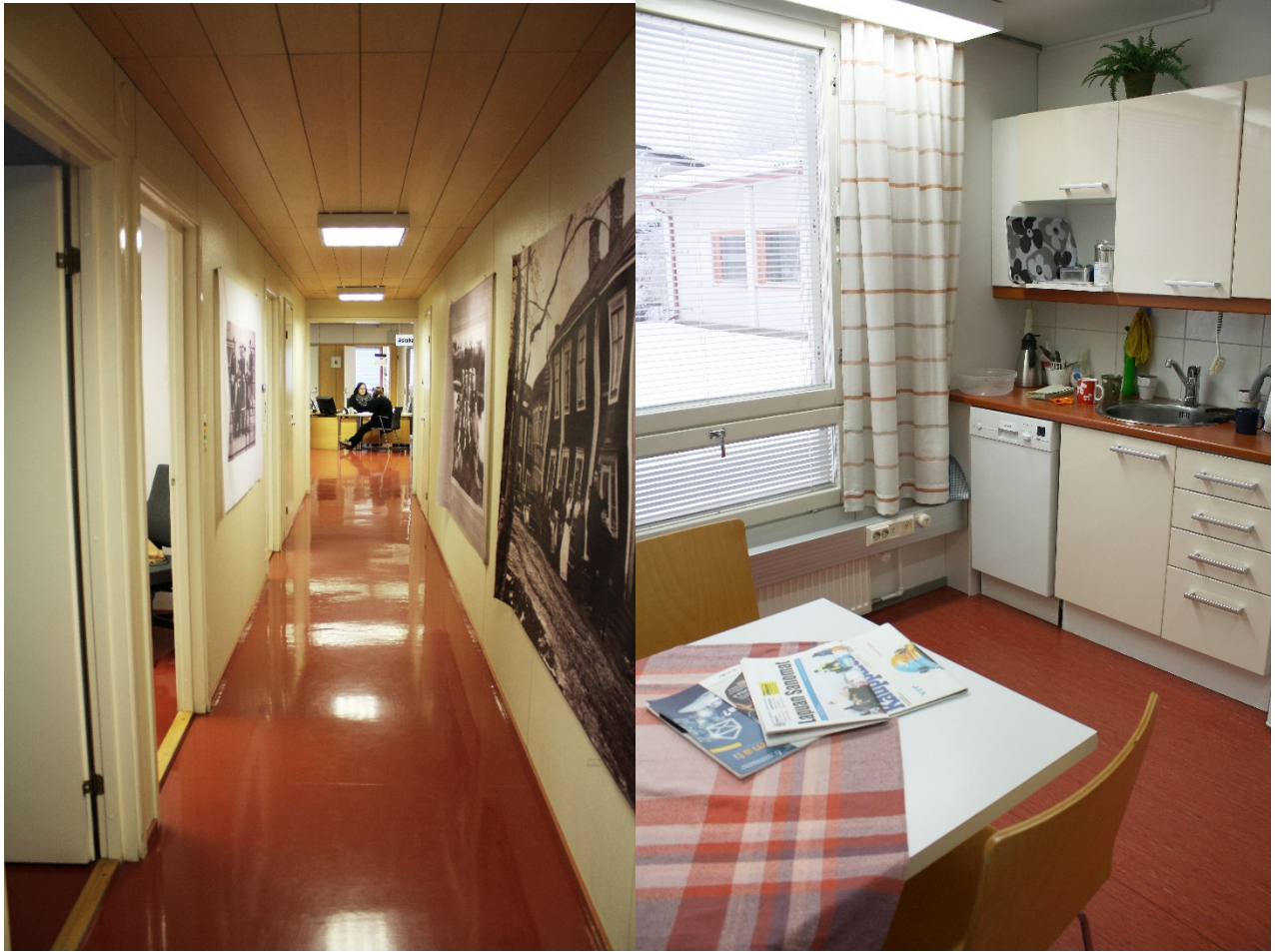
Laajennusosan käytävä ja keittiötila