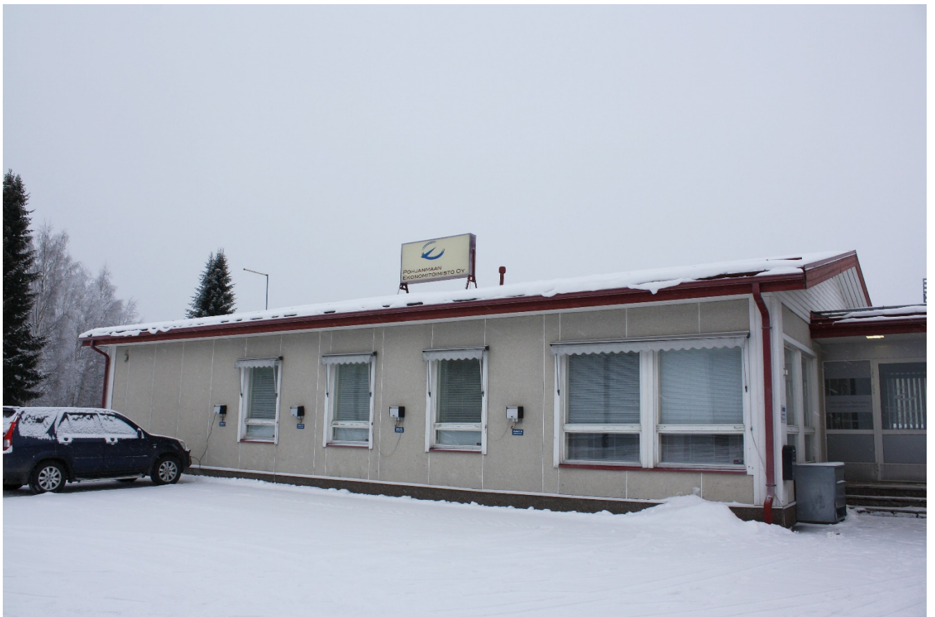
Kiinteistön 1990 valmistunut laajennusosa