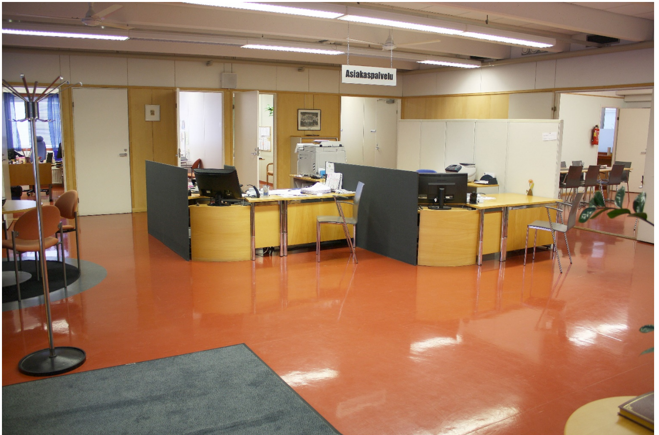
Lapuan Sanomien asiakaspalvelutilaa