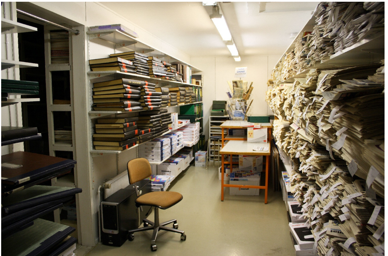
Arkistotilaa löytyy runsaasti