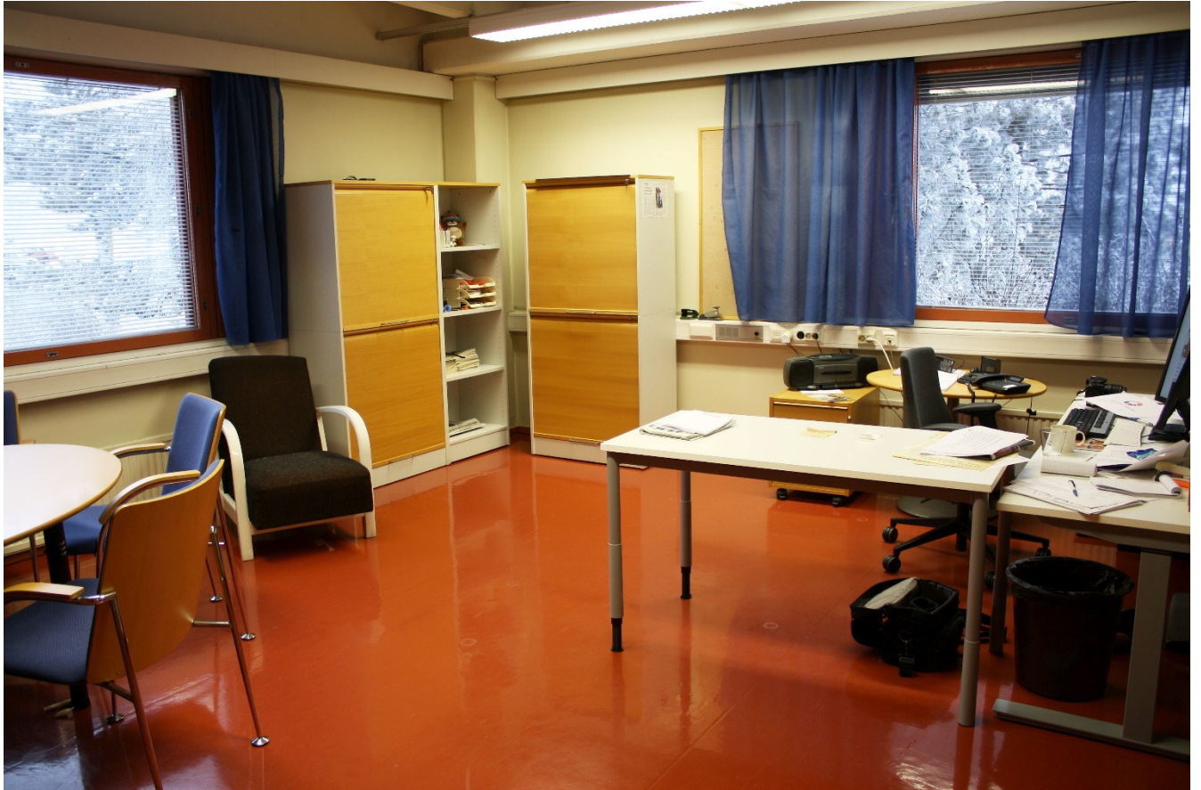
Sanomien puolelta iso työhuone