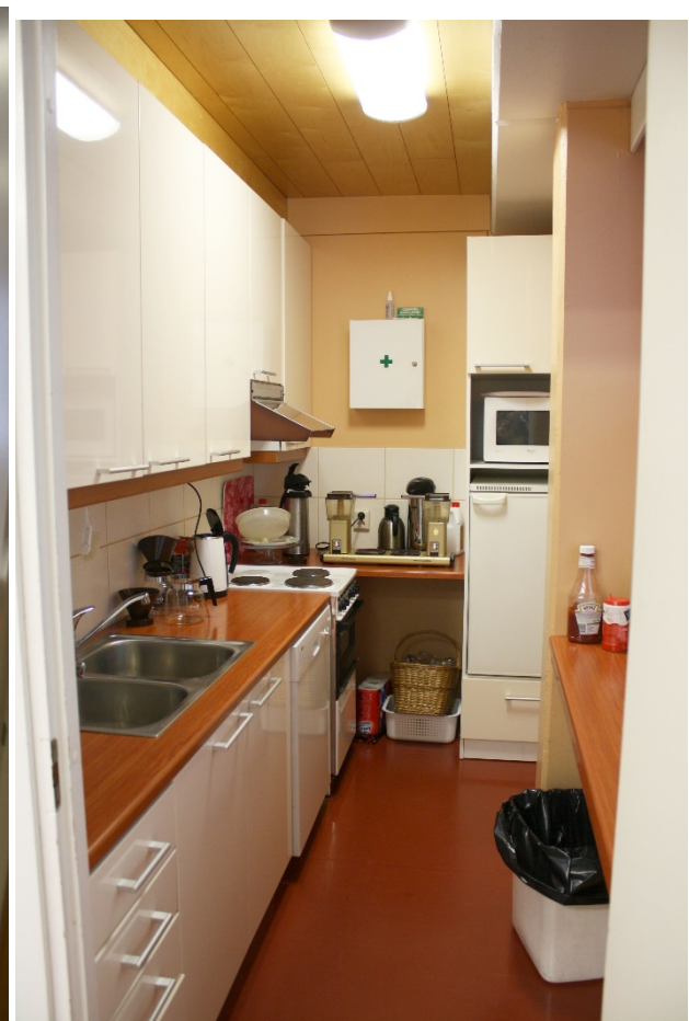
Sanomien puolelta ns. pieni työhuone ja keittiötila